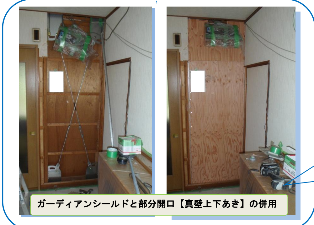
ガーディアンシールドと部分開口【真壁上下あき】の併用

生後間もないお孫さんが居るお宅の改修事例です。お孫さんに配慮してなるべく室内に入らずに補強すること、工事期間を短くすることを目標に設計・施工しました。