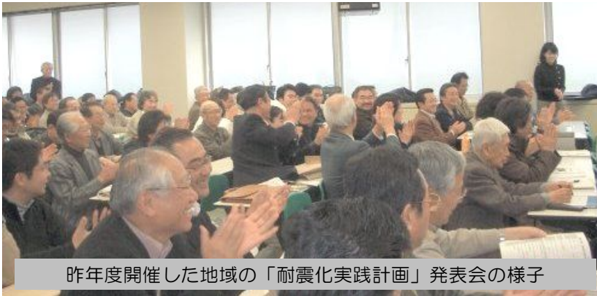
昨年度開催した地域の「耐震化実践計画」発表会の様子

一つの回答として、これから地域で活動を始める耐震化アドバイザーが、実践計画を発表します。