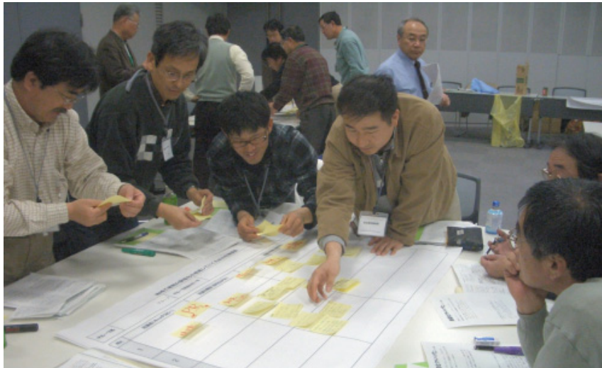
昨年度開催した本講座「地域の耐震化推進策づくり」の様子