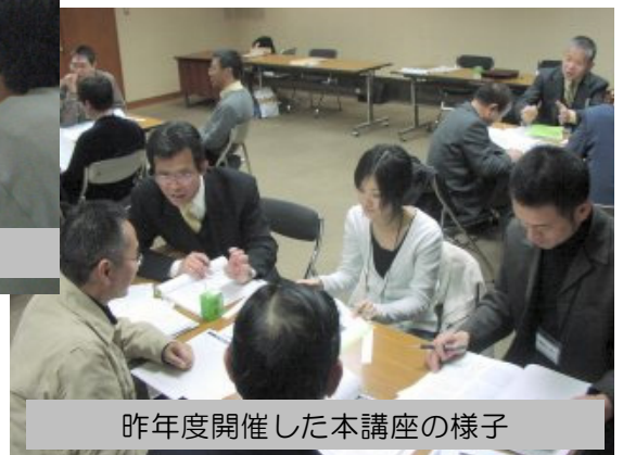
昨年度開催した本講座の様子

その一つの回答として、これから地域で活動始める「耐震化アドバイザー」の卵が考える、地域で耐震化を進めるための実践計画を発表します。